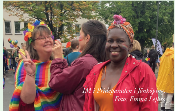
IM i Prideparaden i Jönköping.