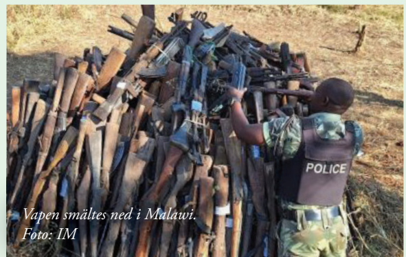
Vapen smältes ned i Malawi.

- Prideflaggan är en av de starkaste symbolerna för mänskliga fri- och rättigheter som vi har. IM går i Pridetåget för att det är viktigare än någonsin att försvara hbtqia+rättigheter, både i Sverige och globalt. Detta i en tid när vi ser både fysiska och verbala attacker och politiska partier vars företrädare ifrågasätter mänskliga rättigheter, allas rätt att älska vem de vill och att få vara sig själva. Vi går tillsammans, i solidaritet med varandra och dem som av olika anledningar inte har möjlighet att gå själva, säger IM:s Amanda Windolf som deltog i Jönköping.