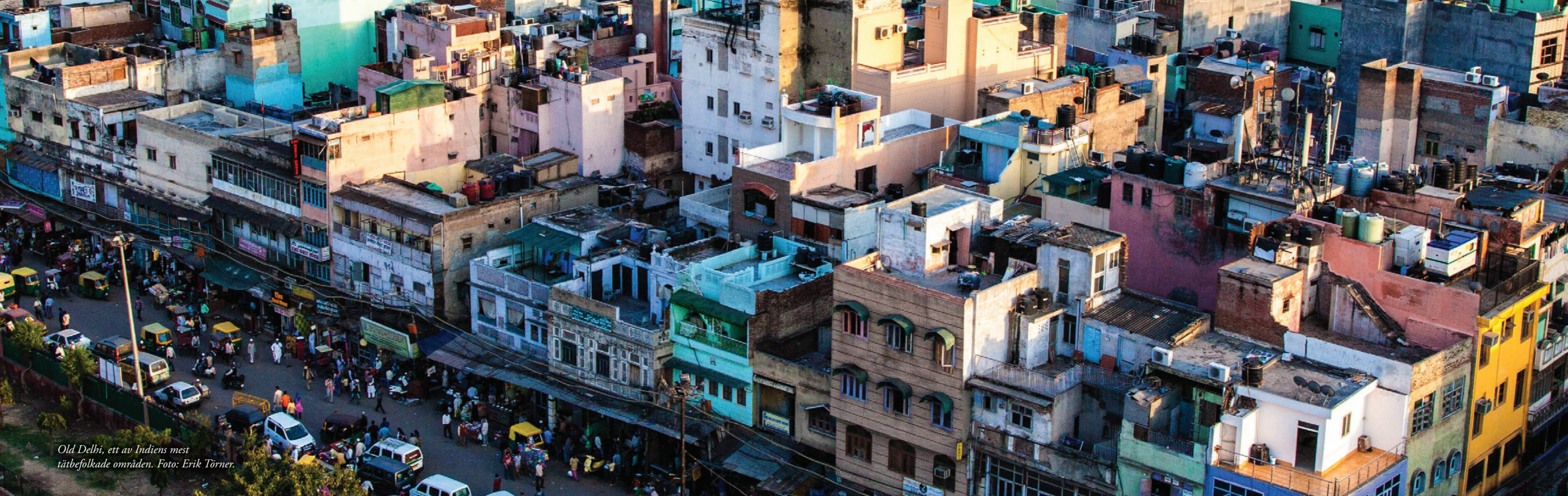
Old Delhi, ett av Indiens mest tätbefolkade områden.