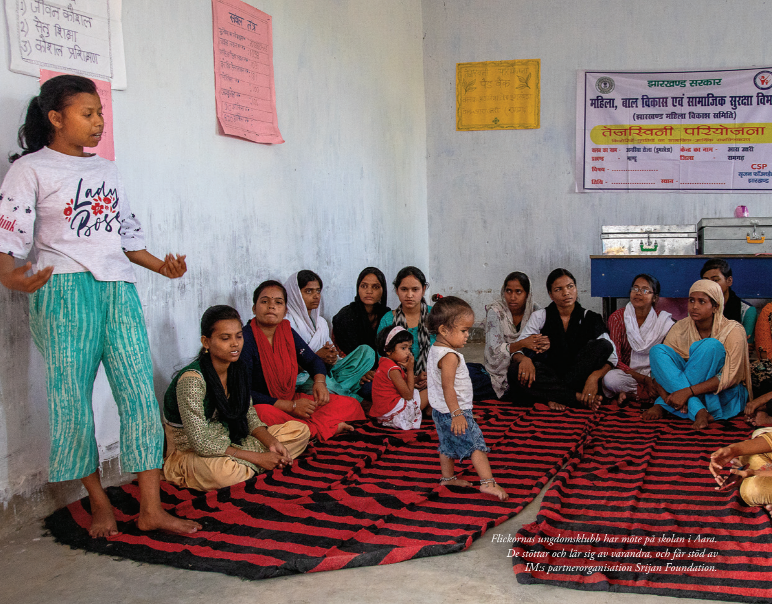
Flickornas ungdomsklubb har möte på skolan i Aara. De stöttar och lär sig av varandra, och får stöd av IM:s partnerorganisation Srijan Foundation.