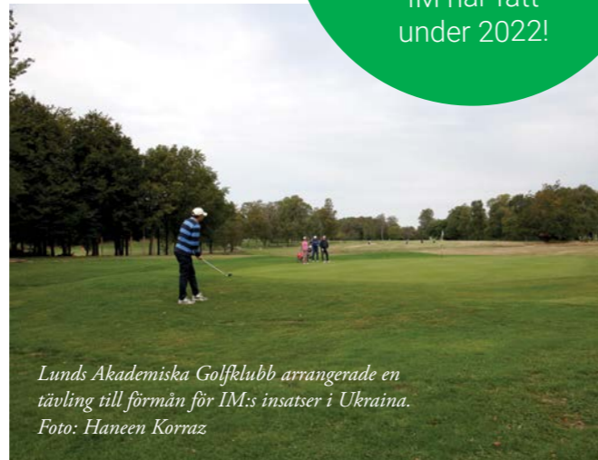
Lunds Akademiska Golfklubb arrangerade en tävling till förmån för IM:s insatser i Ukraina.

för alla gåvor som IM har fått under 2022!