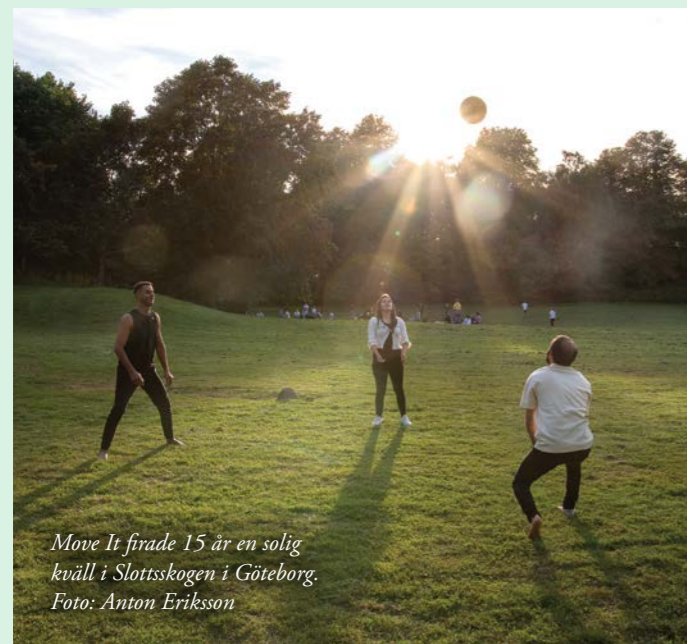
Move It firade 15 år en solig kväll i Slottsskogen i Göteborg.

Deltagarna har fått testa allt från bowling, orientering och skidåkning till bågskytte, ridning och soppåseåkning. Men de har också fått göra många andra slags aktiviteter som att besöka fritidsgårdar, gå på teater och titta på olika idrottsmatcher som Move It har fått biljetter till. Vad gruppen gör beror på volontärernas kontakter och intressen kombinerat med uppbyggda samarbeten med lokala föreningar.