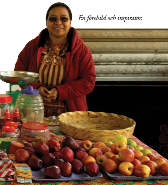
En förebild och inspiratör.