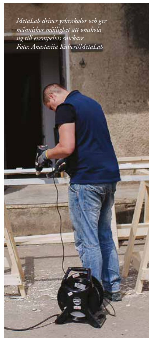
MetaLab driver yrkesskolor och ger människor möjlighet att omskola sig till exempelvis snickare.

”Vi insåg tidigt att det inte kommer att vara hållbart för människor att vara beroende av humanitär hjälp. Det viktiga är att ge människor en känsla av att ha kontroll över sina liv, att ge dem en mening att kämpa. Vårt bidrag är att hitta sätt att få folk i sysselsättning och att hitta bostäder.