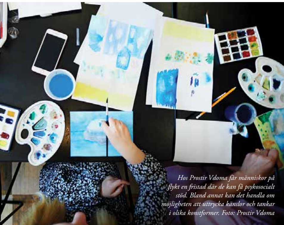
Hos Prostir Vdoma får människor på flykt en fristad där de kan få psykosocialt stöd. Bland annat kan det handla om möjligheten att uttrycka känslor och tankar i olika konstformer.