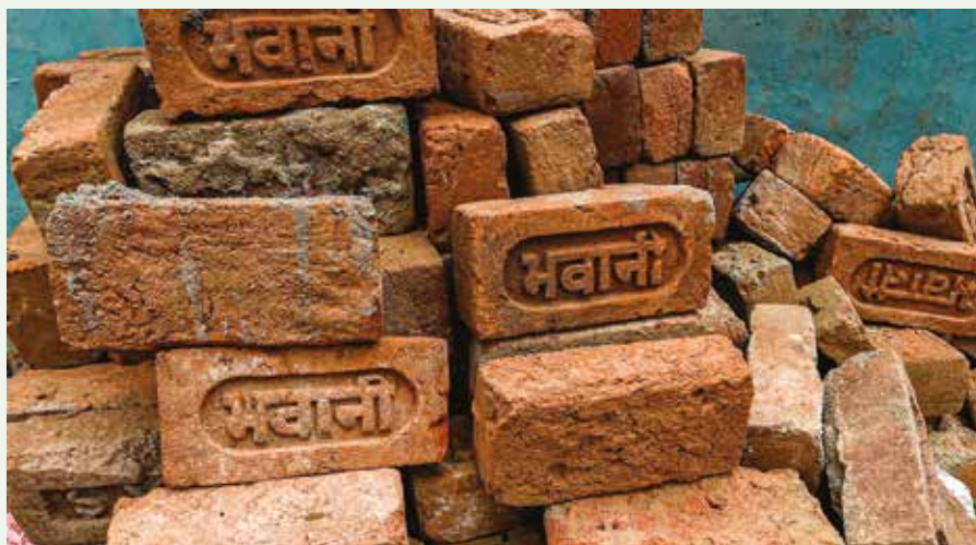
Tegelstenarna symboliserar för många indiska kvinnor det hårda livet som migrantarbetare.