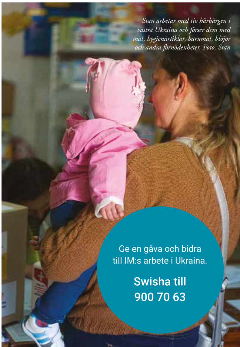
Stan arbetar med tio härbärgen i västra Ukraina och förser dem med mat, hygienartiklar, barnmat, blöjor och andra förnödenheter.

Ge en gåva och bidra till IM:s arbete i Ukraina.