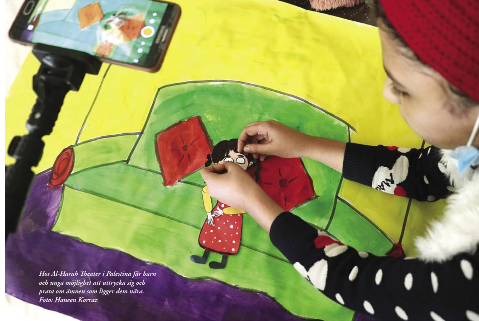
Hos Al-Harah Theater i Palestina får barn och unga möjlighet att uttrycka sig och prata om ämnen som ligger dem nära.

med funktionsnedsättningar i Jordanien har genom utbildningar fått ökade kunskaper kring sina rättigheter när det gäller trakasserier på arbetsplatser.