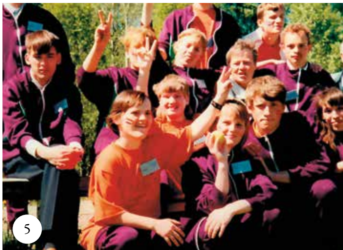
Teatergrupp från Lettland på besök 1997.

”Huset i Vrigstad förlorar vi, men vi skapar hela tiden nya mötesplatser, både digitala och fysiska. Och fler nyanlända flyktingar kommer att möta oss på IM och våra värderingar.”