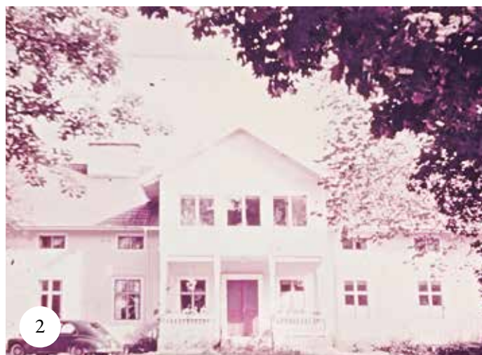
Vrigstadhemmet våren 1945, precis köpt av IM.