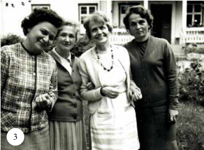
Samtal i trädgården 1964.

”I Vrigstad byggde IM mycket av sin ideologi, med ’IM-hemmet’ som modell för en helhetssyn på människan, att en människa inte bara är kött och blod, utan även själ och ande.”