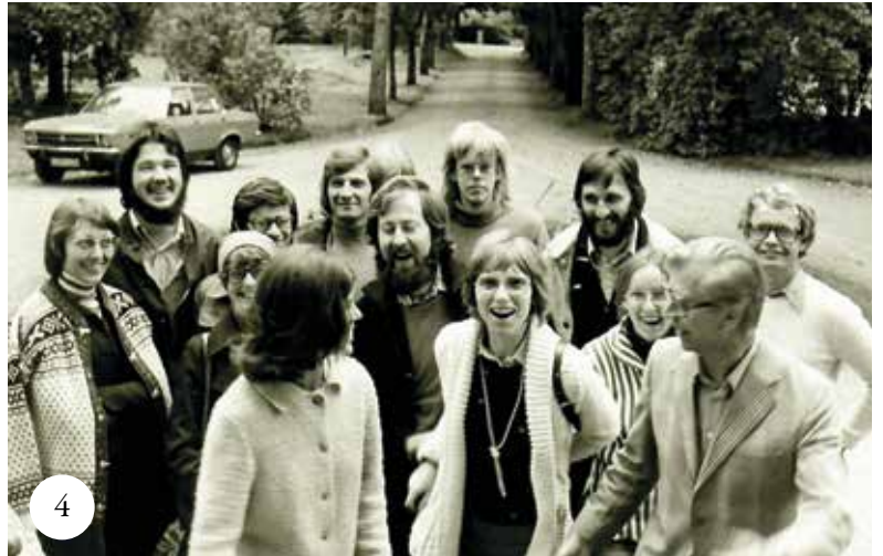
Gäster hälsas välkomna på trappan 1978.