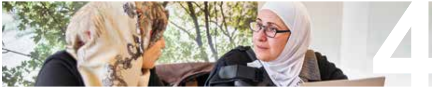
TEMA VERKSAMHETEN I SVERIGE sidan 4