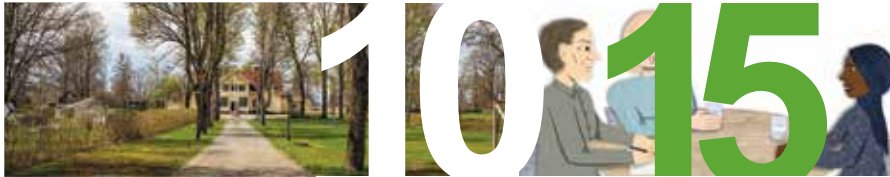
VRIGSTADHEMMET I VÅRA HJÄRTAN sidan 10–13