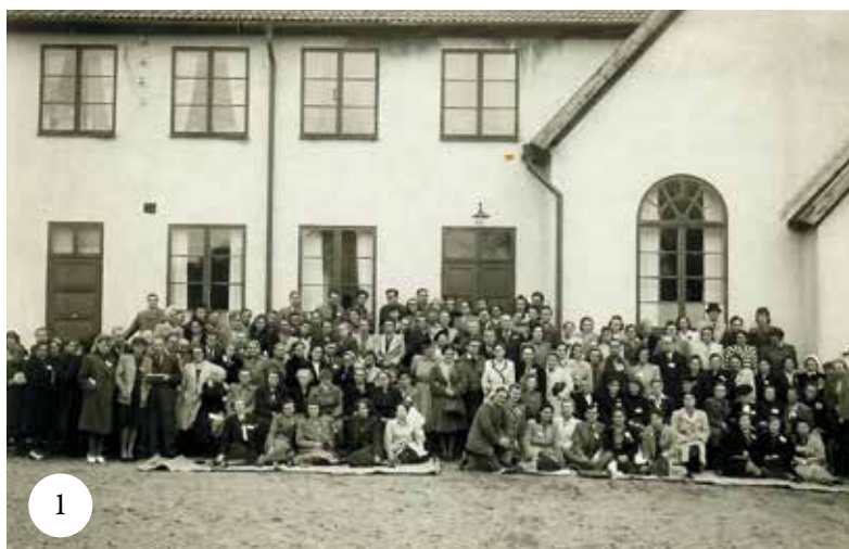
Den svensk-polska konferensen i Vrigstad 1945.