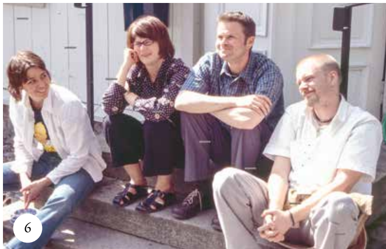
Ett av många tillfällen då IMs alla utlandsvolontärer träffats på Vrigstad, 2003 (artikelförfattaren till höger).

Efter att först ha fungerat som flyktingboende har Vrigstadhemmet på senare år varit bas för IMs verksamhet i Småland med insatser inom integrationsområdet, hotellverksamhet och öppna aktiviteter som till exempel soppluncher samt många planeringsdagar och möten för IMs medarbetare.