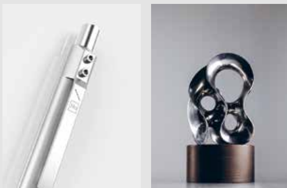
A Good Humanium Metal Pen. Right Livelihood-priset.