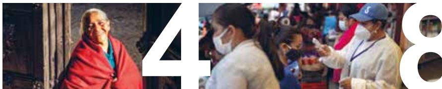
DET HÄR ÄR IM sidan 4–5