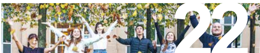
IMs VERKSAMHET I SVERIGE sidan 22–25