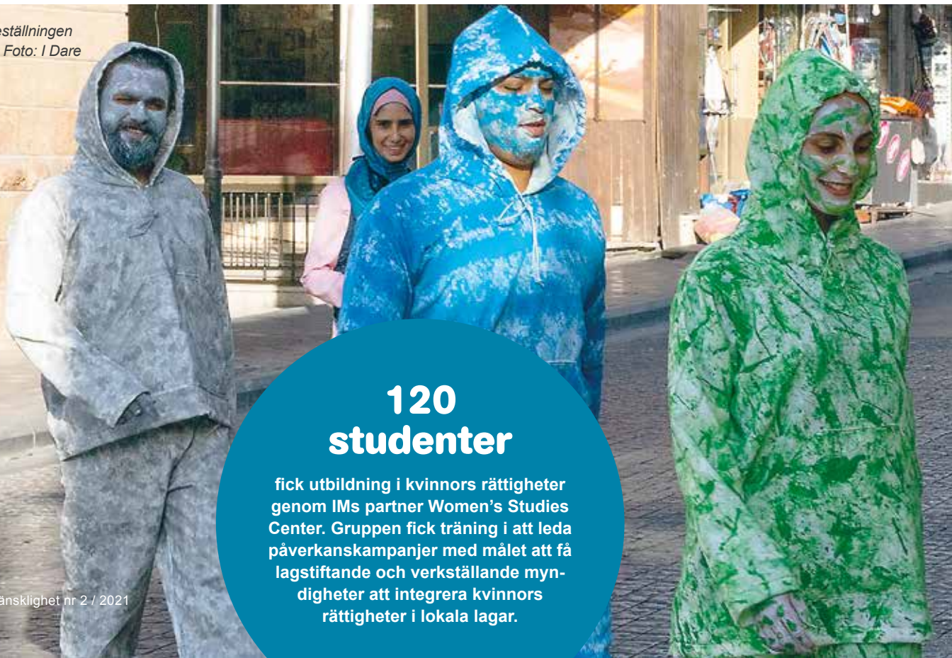
Ungdomar i gatuföreställningen Colored i Jordanien.

– Föreställningen sätter ljuset på begreppet mångfald och att välja gatan som scen är en ut-