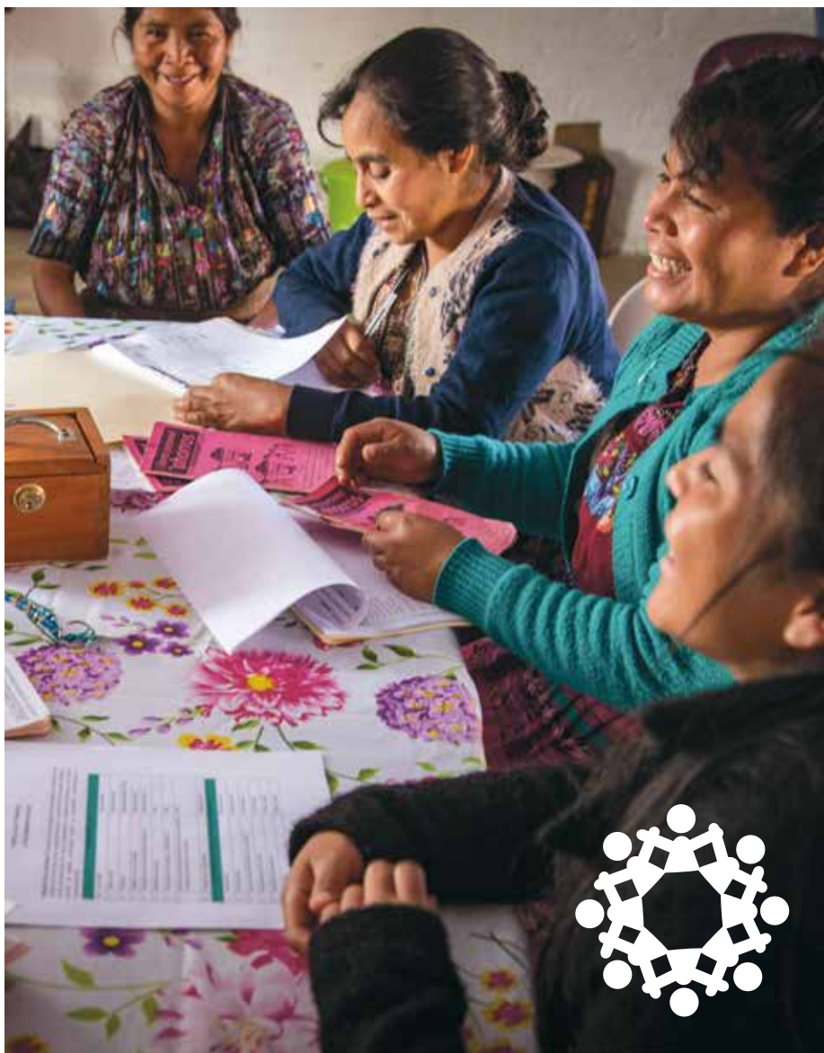
Gemensamt sparande, jämställdhet, demokrati, skratt och fika – allt blandas när kvinnogruppen Gaviotas har möte i Solola, Guatemala.

Medmänsklighet trycks av Trydells som är ett Svanenmärkt tryckeri.