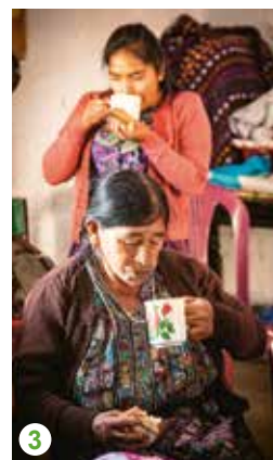
1 Guatemala. Foto: Erik Törner 2 Malawi. Foto: Malin Kihlström 3 Guatemala. Foto: Erik Törner

Under 20 år som kommunikatör för IM har jag besökt och berättat om hundratals biståndsinsatser runtom i världen. Det är så mycket som skiljer insatserna åt; miljöerna, människorna, kulturerna och problemen som ska lösas. Men en sak verkar alltid återkomma: kvinnorna – och kvinnogrupperna. Text: Erik Törner