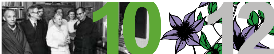
IM OCH FREDSTANKEN sidan 10–11