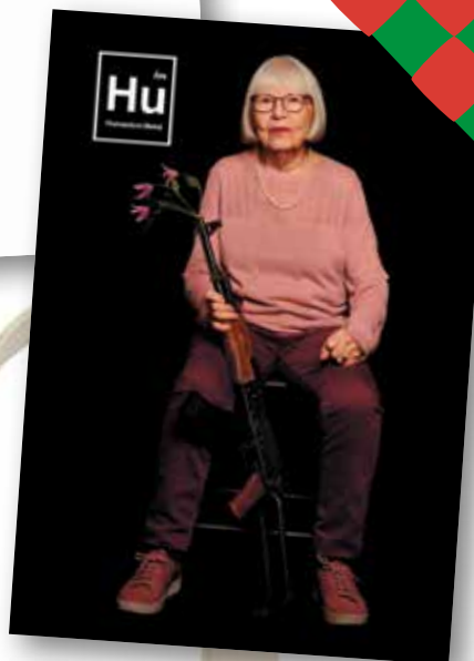
kort i A5-format