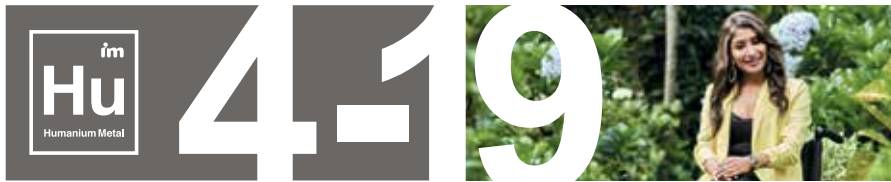
TEMA HUMANIUM METAL sidan 4–19