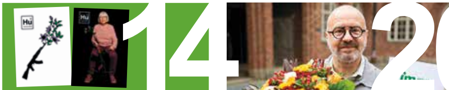
JULKLAPPAR FÖR FRED sidan 14–15