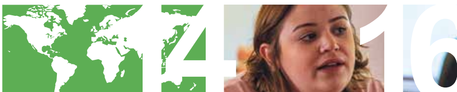
CORONAKRISEN I IMs LÄNDER sidan 14–15