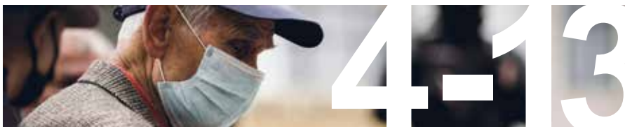
DEN GLOBALA KRISEN sidan 4–13