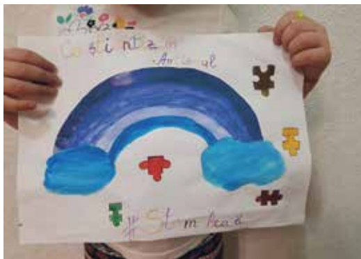
För att uppmärksamma World Autism Awareness Day organiserade vår partner SOS Autism en virtuell flashmob för barn.