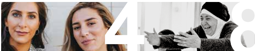
TEMA – MINSKAD OJÄMLIKHET sidan 4–11