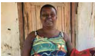
DIN GÅVA GER RESULTAT sidan 16–17