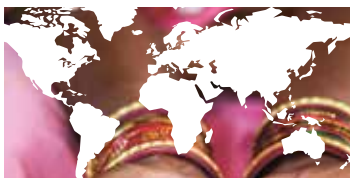
JORDEN RUNT sidan 12–13