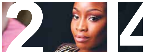
"RASISM ÄR SOM ETT LADDAT VAPEN" sidan 14–15