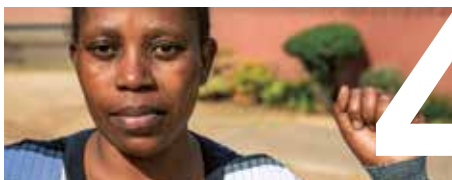
KUNGEN BESTÄMMER ALLT sidan 4–9