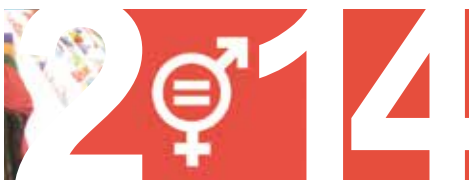
DE GLOBALA MÅLEN sidan 14