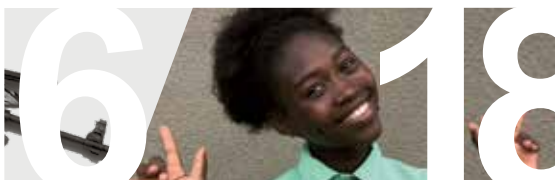
NU VÅGAR JOYCE DRÖMMA IGEN sidan 18–19