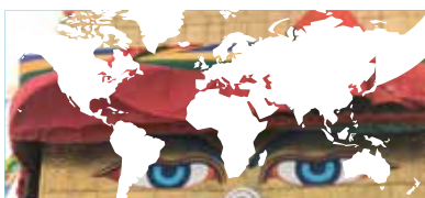
JORDEN RUNT MED IM sidan 12–13