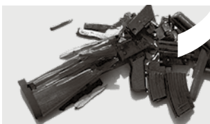
HUMANIUM METAL BY IM sidan 16–17