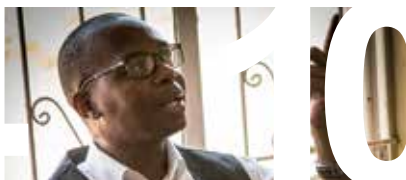
IM GER OSS EN STARKARE RÖST sidan 10–11